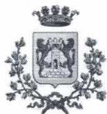
Città di Bassano del Grappa